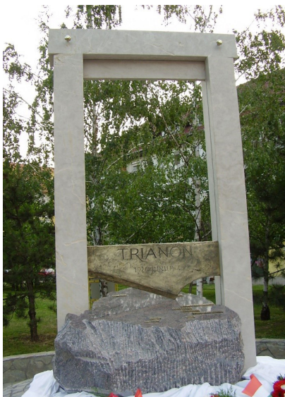
Afbeelding 3. Trianon-standbeeld te Békéscsaba.

Zelfs Horthy wordt in een positief daglicht geplaatst. Zo roemde Orbán de regent in 2017 als een 'uitzonderlijk staatsman'. 9 Een opmerkelijke keuze, aangezien de reputatie van Horthy niet bepaald vlekkeloos is. Los van een debat over Horthy's rol in de