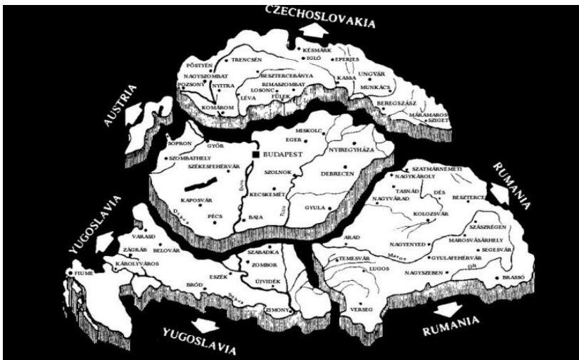
Afbeelding 1. Kaart van de verdeling van Groot-Hongarije.

Buiten Hongarije zullen nog maar weinig mensen het Verdrag van Trianon kennen. Het is een van de vijf vredesverdragen die de overwinnaars na de Eerste Wereldoorlog sloten met de verliezers. Het is het minder bekende broertje van het Verdrag van Versailles met Duitsland. Of, zoals veel Hongaren ook vandaag de dag nog zeggen, het ‘dictaat’ dat Hongarije op