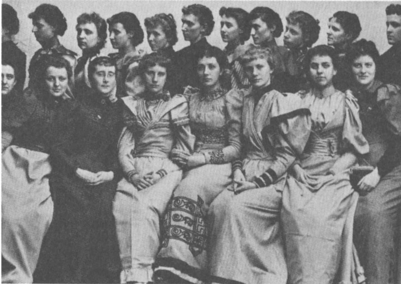
Studentes aan de Cornell University van 1890 en later Uit: Ch.W. Conable, Women at Cornell. The myth of equal education. Ithaca/Londen (CUP) 1977.

tussen de twee wereldoorlogen is gebeurd. 3 Volgens anderen echter hebben seksuologen als Richard von Krafft-Ebbing, Havelock Ellis en Cesare Lombroso een desastreuze invloed gehad op romantiese vriendschappen, waardoor ze uiteindelijk 'ziekelijk en abnormaal' werden gevonden. Het door medici verleende predikaat 'afwijkend' had volgens deze critici een uiterst schadelijke invloed op vrouwen. 4 Deze historici waren gepreokkeerd met de juiste tijdsbepaling: wanneer precies worden de theorieën van de medici bekend bij het grote publiek? Welke invloed had die bekendheid? In welke tijd kan het begin van de algemene afkeuring van vrouwenvriendschappen