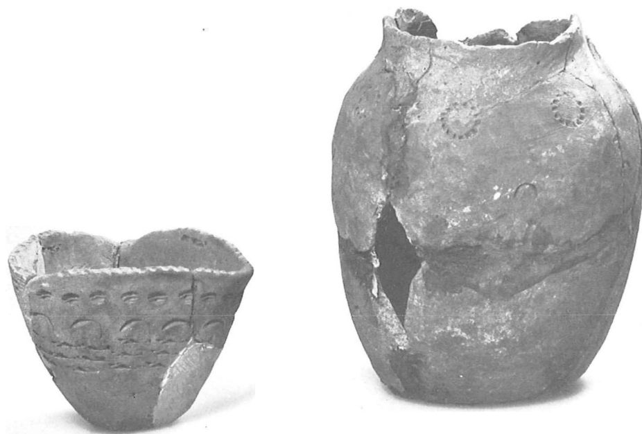
Afb. 6. Twee versierde potjes, afkomstig uit de collectie van mr. S. van Kempen (1937/VII 104 en 105). Falsificaten.

beitels bewaard gebleven, waardoor het nu mogelijk is deze historie met voorbeelden te illustreren. Ook het Rijksmuseum van Oudheden heeft een aantal bewaard.